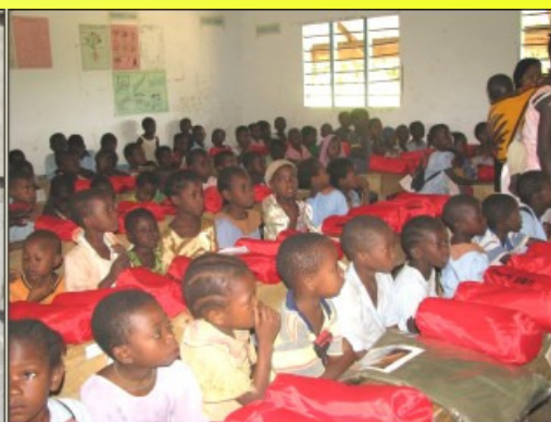
Jeder hat ein rotes Säckchen (Moskitonetz) bekommen ☺ ☺ ☺