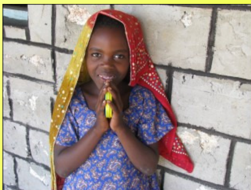
Eine Kinderhautcreme nur für Dich ☺

Alle im Jahr 2008 begonnenen Projekte zur Unterstützung der Mwazaro Nursery School konnten erfolgreich beendet werden. Wegen der großen Dürre wurde unsere Hilfe dringend benötigt, so dass zwei Projektreisen durchgeführt werden mussten. Dabei haben wir insgesamt über 300 kg Spendengepäck nach Kenia gebracht.